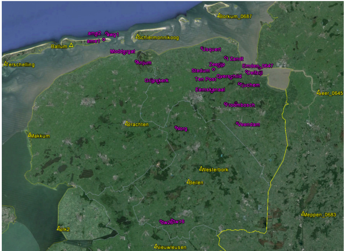
Overzichtskaart alle GPS-referentiestations (geel) en GPS-monitorstations (paars).

In de grafieken op pagina 3 t/m 5 zijn de continue GPS metingen op de locaties Ameland-Oost, Anjum en Moddergat weergegeven.