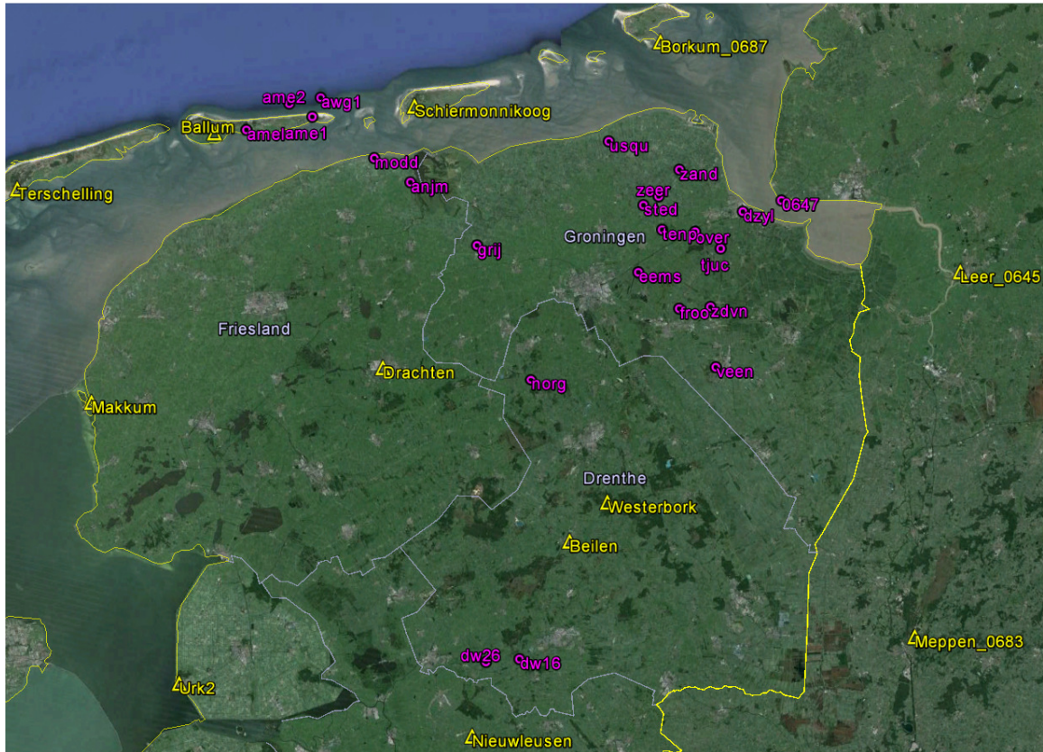
Overzichtkaart alle GPS-referentiestationen (geel) en GPS-monitorstations (paars).

In de grafieken op pagina's 3 en 4 zijn de continue GPS metingen op de locaties 'De Wijk 16' en 'De Wijk 26' weergegeven.