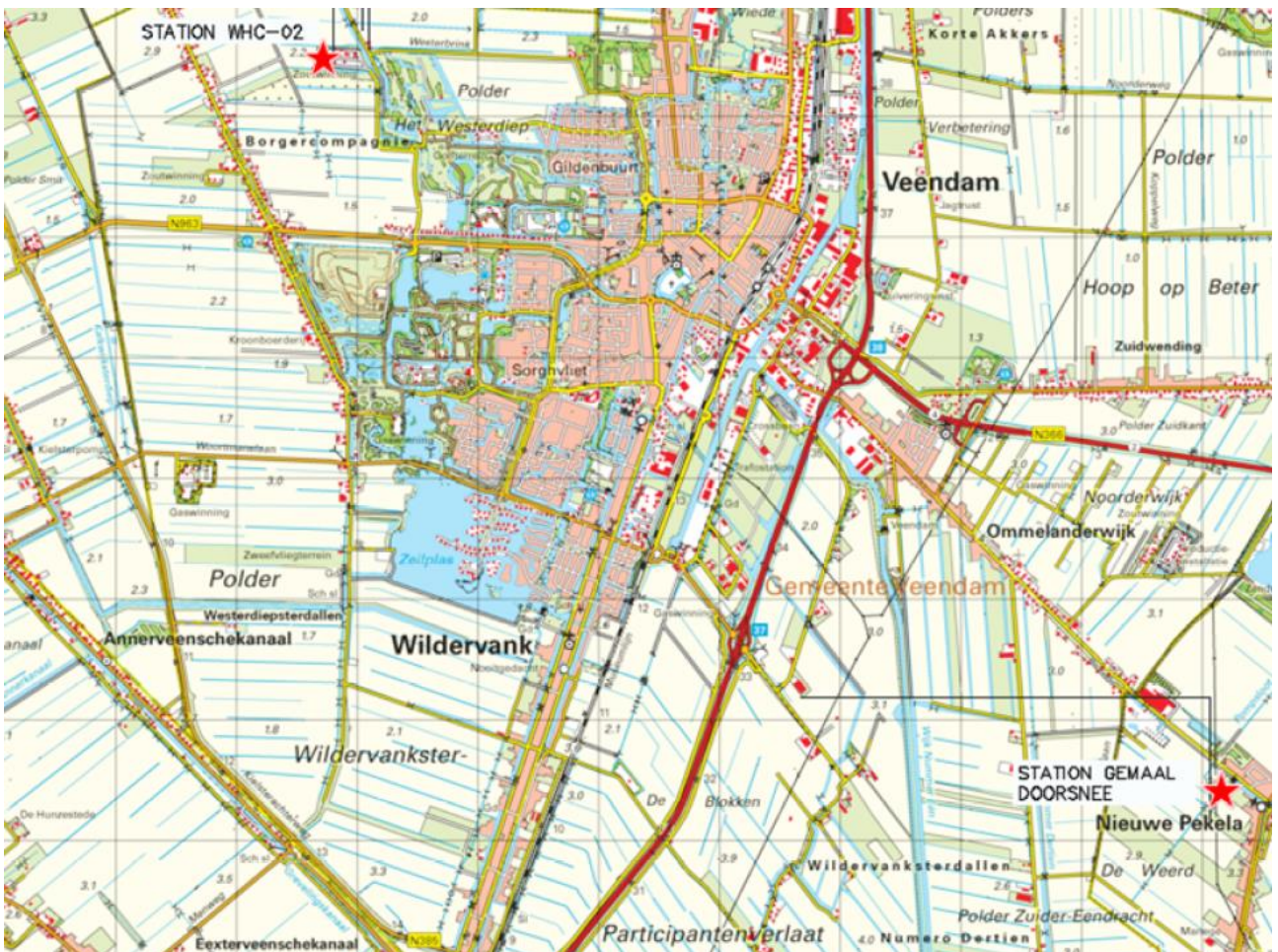
Figuur 3: Locatie GPS station WHC-2 en referentiestation Gemeal Doorsnee (rode sterren)