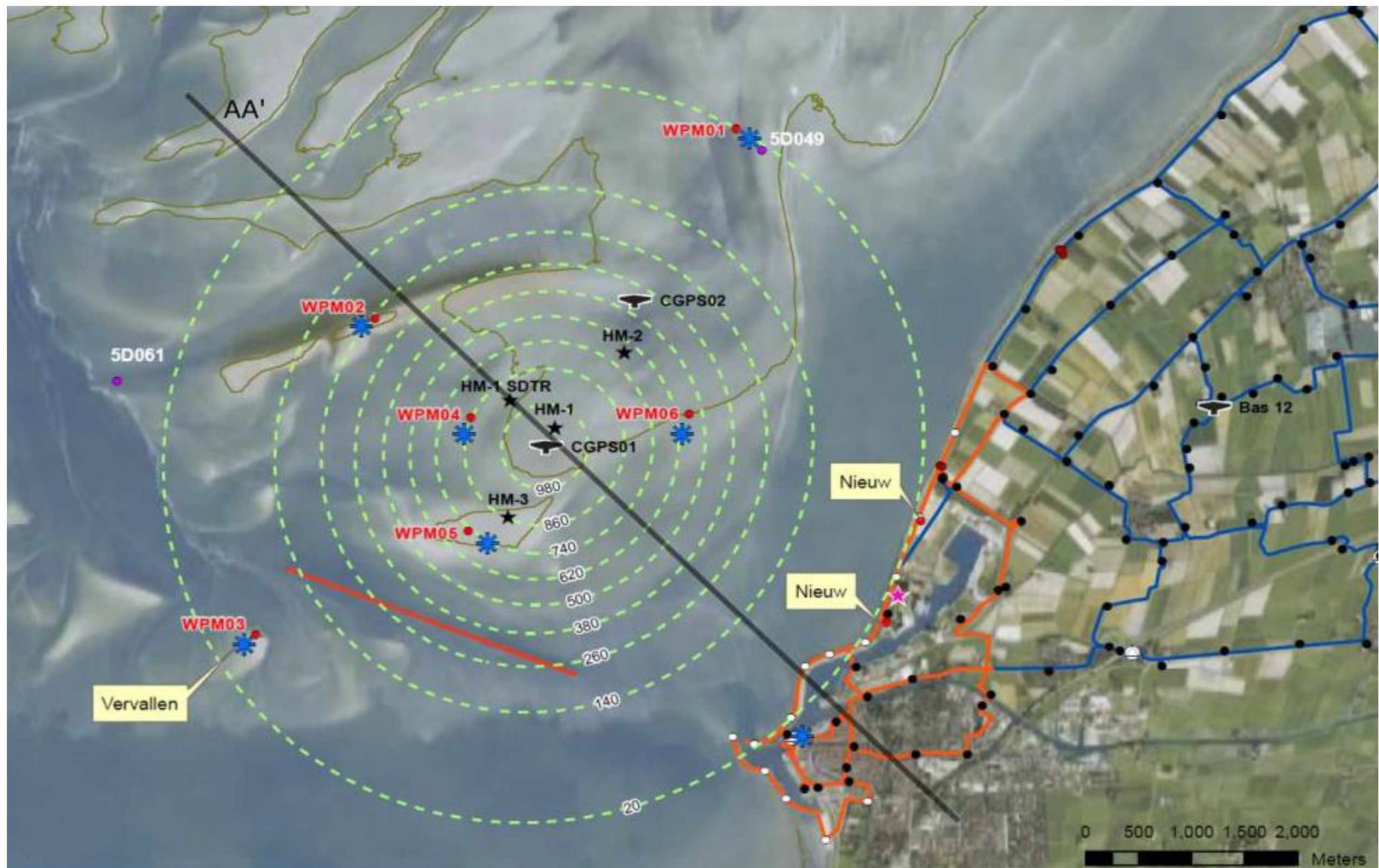
Figuur 2: Gekozen doorsnede door de voorspelde bodemdalingsschotel.