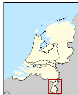
Figuur 7.1 Vergunningen voor steenkool per 1 januari 2026.